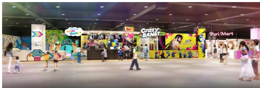
「CAPCOMIX みなとみらい店」イメージ

MARK IS みなとみらいにグランドオープンする「CAPCOMIX みなとみらい店」および「カプコンストア ミナトミライ」は、総面積800坪超の大型アミューズメント施設として、MARK IS みなとみらいと株式会社カプコンが、約4年にわたり準備を重ねてきた一大プロジェクトで、MARK IS みなとみらいの掲げる「ライフエンターテインメントモール」のテーマをより一層強化していく施設となります。