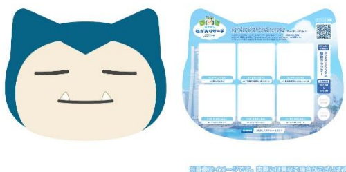
※スタンプラリー台紙 イメージ