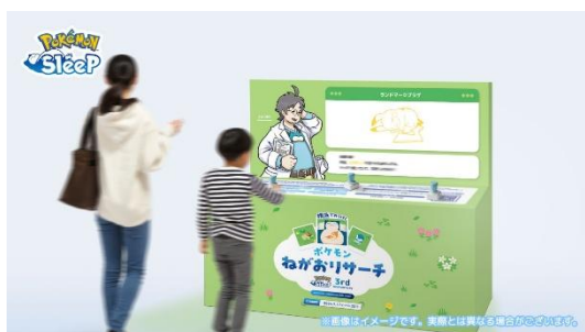
※スタンプラリー台 イメージ