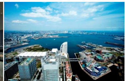
スカイカフェ / 横浜・空の図書室(昼) / 横浜・空の図書室(夜) / スカイガーデンからの眺望