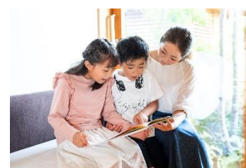
読み聞かせ教室 ブレーメン

ホームページ： https://bre-men.co.jp/ 公式インスタグラムアカウント：@yomikikasebremen